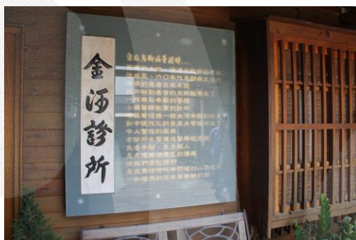
圖 8-20 金河診所

以「臺灣烏腳病醫療歷史紀念館」為中心，與其側邊北門嶼教會及「北門嶼免費診所紀念館」，以及對面王金河故居所在的「臺南市旅遊服務中心」等，連結成「臺灣烏腳病醫療紀念園區」，「帶動了北門、將軍、七股等地區濱海遊憩活動，使活動內容除具有自然風景、廟會活動與美食小吃之外，更兼具人文歷史與醫療之旅」。 66