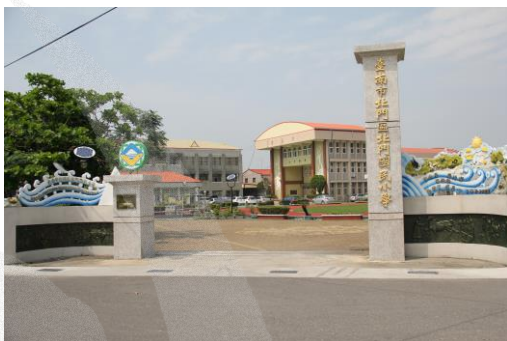
圖 8-8 北門國小