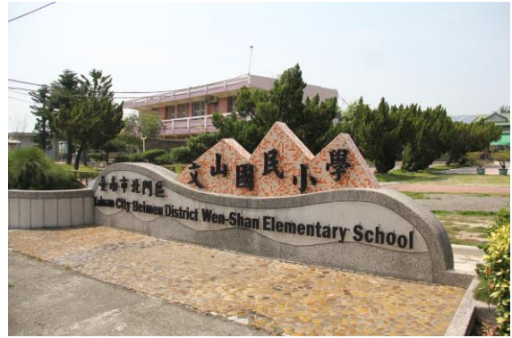
圖 8-13 文山國小