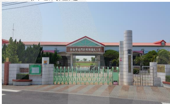
圖 8-14 錦湖國小