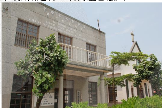
圖 8-22 免費診所

此外，一進免費診所的右側即可看到一張醒目的電影海報：《一隻鳥仔哮啾啾》（張志勇導演、由黃崇雄小說改編電影劇本、歌仔劇演員唐美雲及布袋戲國寶大師李天祿參與演出，並獲得第 42 屆亞太影展最佳影片）。該片係以 50 年代北門鄉的烏腳病為拍攝題材，劇情溫馨感人。