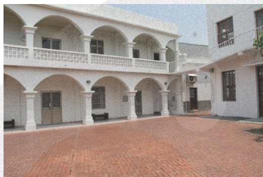
圖 8-23 免費診所後方(小白宮)