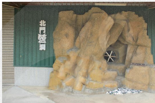
圖 8-11 北門鹽洞