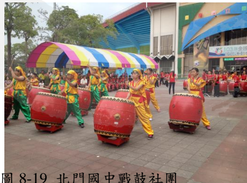
圖 8-19 北門國中戰鼓社團