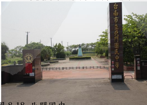
圖 8-18 北門國中