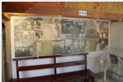
圖 8-21 烏腳病醫療歷史紀念館內部一隅