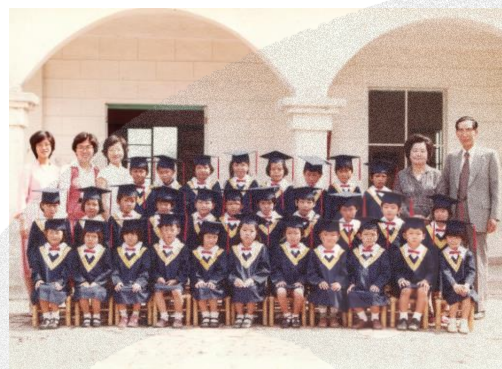
圖 8-6 芥菜種幼稚園畢業照