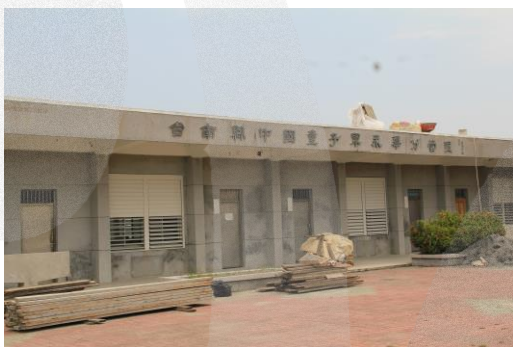
圖 8-10 中國童子軍永華分營區

自廢校以來，校地作為中國童子軍永華分營區，(圖 8-10)如北門國小曾於 91 年 5 月辦理為期 2 天的「永華營區」畢業班大露營。103 年校地由雲嘉南濱海國家風景區管理處正式接管，校地再生，並擬規劃為「魔法生態學園」，結合鹽埕、潟湖和濱海溼地豐富的教育生態，開發為戶外探索樂園；同年年底，雲管處將校地租給財團法人臺灣外展教育基金會，成立「雲嘉南共好中心」，打造海洋教育和戶外冒險的基地。 53 (圖 8-11)