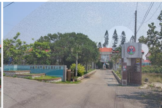
圖 8-15 雙春國小