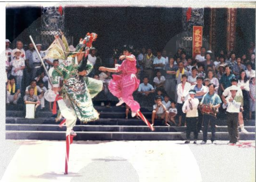
圖 8-17 三慈國小高蹺陣