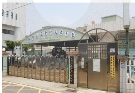
圖 8-7 北門區農會附設幼稚園

民國 38 年即成立，至 92 年始正式立案設立(屬社福機構)。原為因應農忙而成立的農會附設私立托兒所，園童人數最多時曾超過 120 名以上，但約自 94 年之後，入園兒童數明顯衰