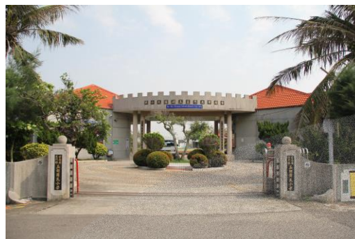
圖 8-9 玉湖分校