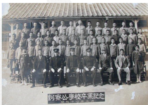
圖 8-2 昭和 16 年蚵寮公學校畢業紀念照

本校源於大正 11 年設立之北門公學校溪底寮分教場；昭和 13 年分教場獨立，改稱溪底寮公學校；昭和 16 年，改稱溪底寮國民學校。(圖 8-3)