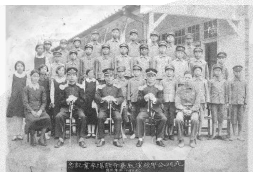
圖 8-3 昭和 13 年溪底寮分教場畢業紀念照