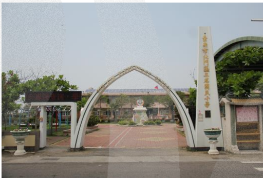
圖 8-16 三慈國小