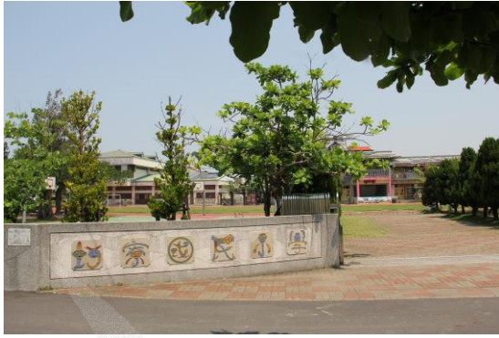
圖 8-12 蚵寮國小